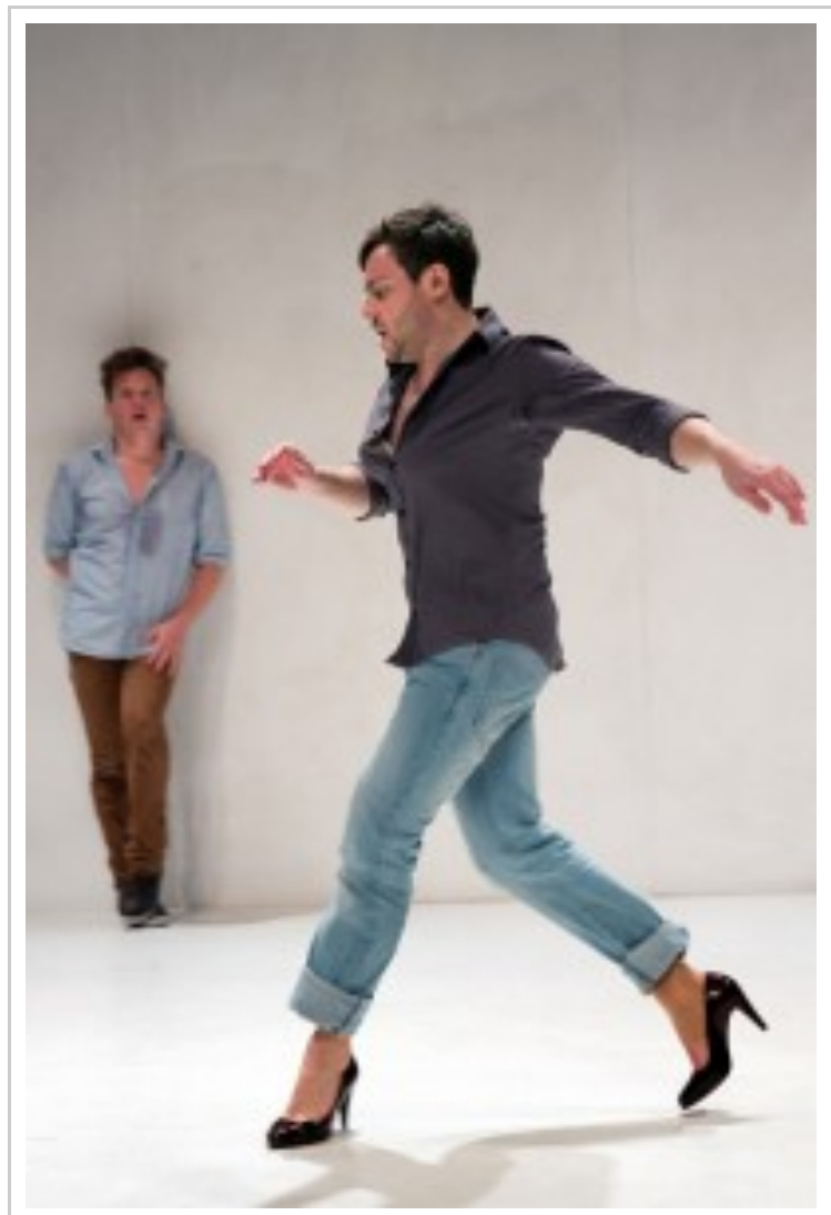
Voetbal op hoge hakken