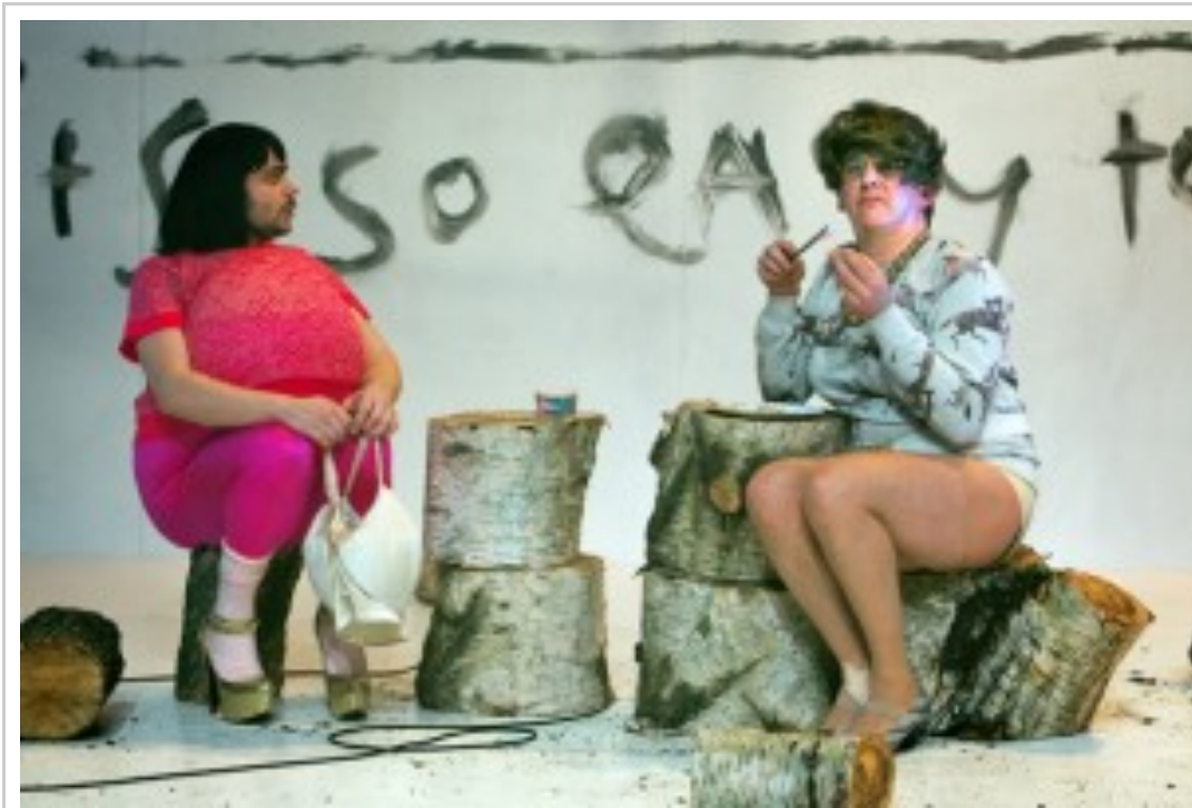
Voetbal op hoge hakken

De volgende scènes zijn een eenvoudig en logisch vervolg: er is toenadering en aarzeling, Woorden zijn totaal overbodig. Aankijken is ook aanvoelen en dat zegt genoeg. Bewegen is een interactieve taal. Geen gebarentaal maar een houding, een duidelijk innemen van een bepaalde plaats in de ruimte, een aanwezig zijn in de tijd. Tenslotte leiden de bewegingen tot handelen, tot het aanvaarden van de andere en het verder bewijzen van de eigen persoonlijkheid. Wat men gewoonlijk als mannelijk en vrouwelijk bestempeld, verdwijnt in een samen spelen en een samen voelen, een samen opgaan in een nieuwe alweer niet direct verifieerbare beweging en ook in een vaak weerkerende handeling, want leven is repetitief.